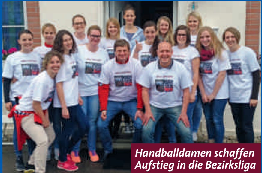
Handballdamen schaffen Aufstieg in die Bezirksliga