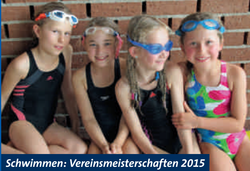
Schwimmen: Vereinsmeisterschaften 2015