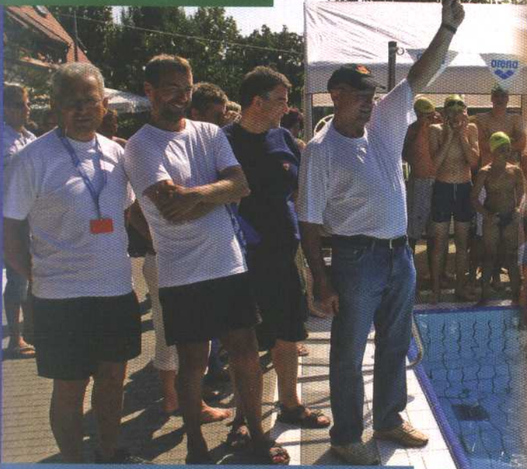
24-Stunden-Schwimmen mit 472 Teilnehmern