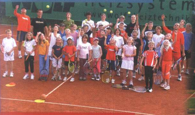
Erfolgreiches Jugendcamp der Tenniser