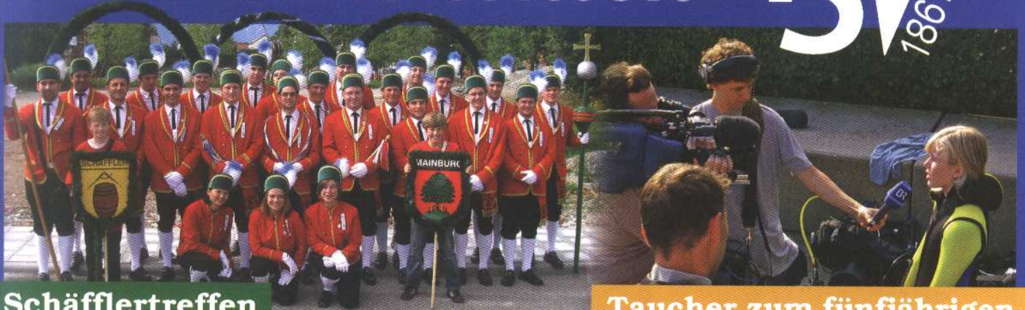
Schäfflertreffen in Murnau