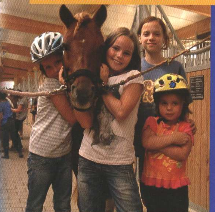
Tag der offenen Stalltür