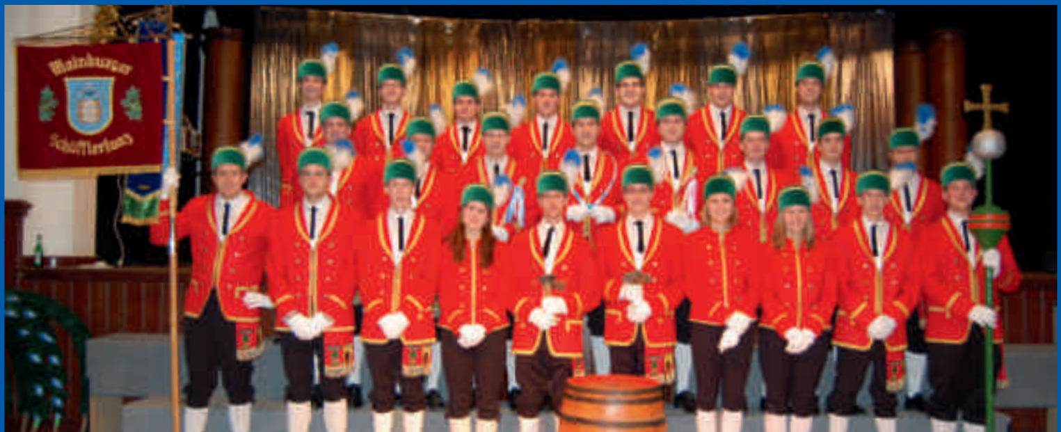
Die Schäffler tanzen wieder – Gelungener Auftaktball am 13. Januar 2012