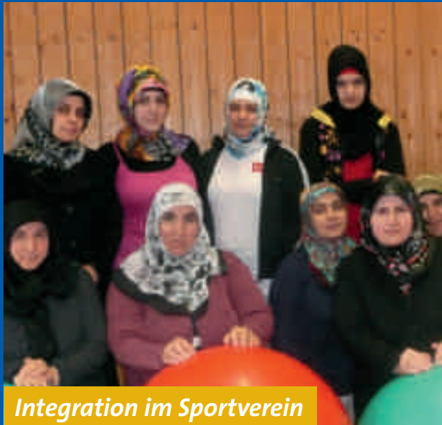
Integration im Sportverein